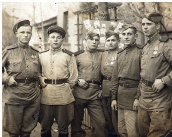
г. Нордхаузен, 1945 г.